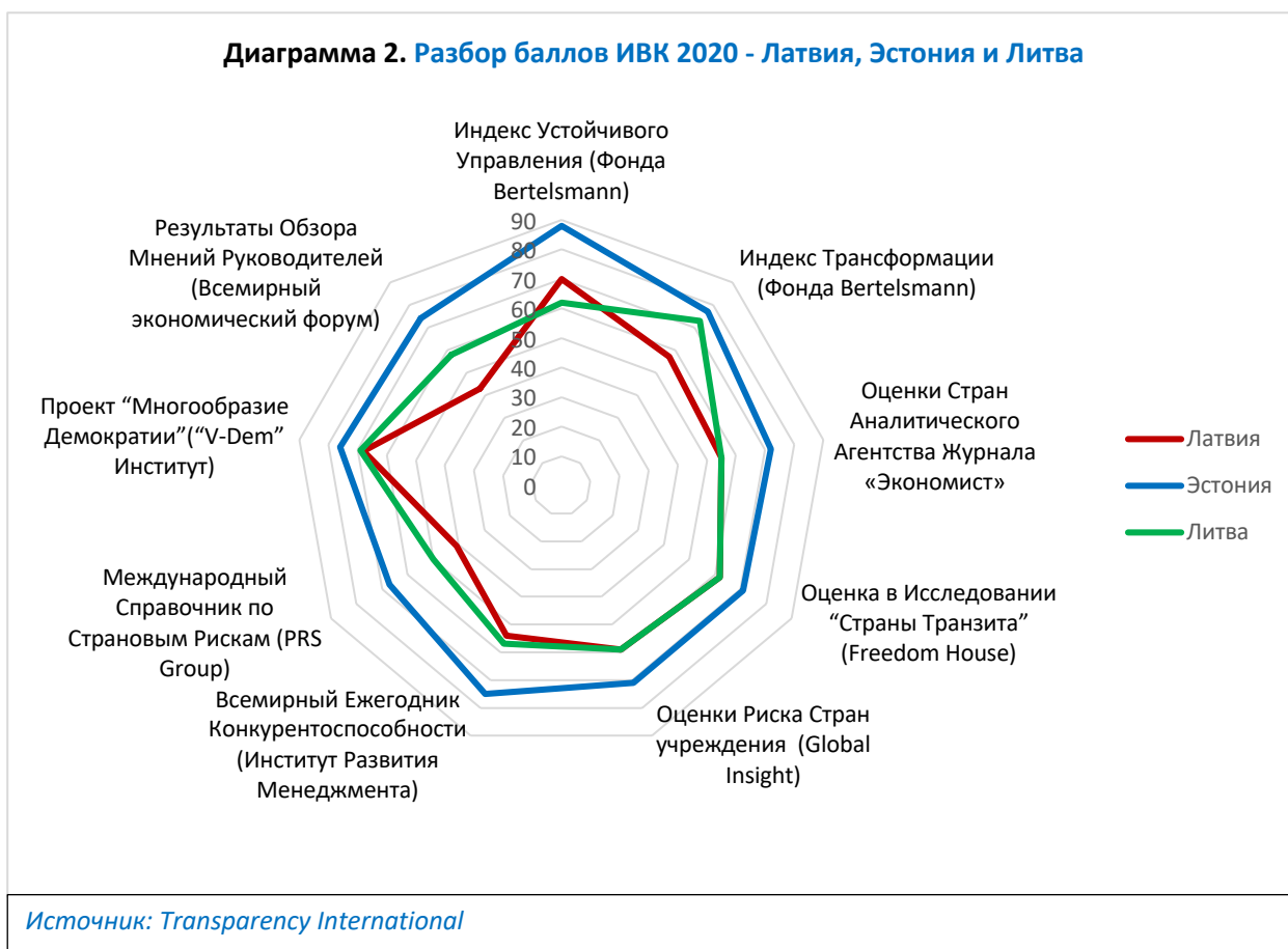
Диаграмма 2. Разбор баллов ИВК 2020 - Латвия, Эстония и Литва

Более тщательный анализ конкретных вопросов, рассмотренных в данных источниках, и их выводов показывает, что Латвии необходимо увеличить свои усилия по крайней мере в трех сферах чтобы догнать другие страны Балтии и ЕС: судебное преследование коррупции, политическая добросовестность и предпринимательская добросовестность.