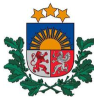
Sabiedrības integrācijas fonds