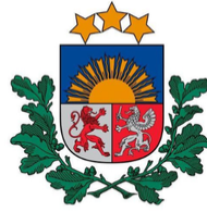
Sabiedrības integrācijas fonds